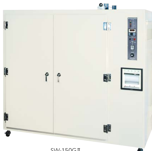
SW-150GII (記録計はオプション)

独自の機構で精度の高い温度分布が得られ、容量 800 ℓ / 1,296 ℓ / 2,250 ℓ の3タイプから選べます。